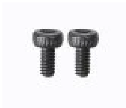
Rys. 2. M2 x 4 mm 2 szt