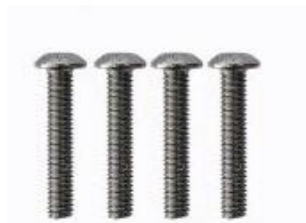
Rys. 4. M3 x 16 mm 4 szt