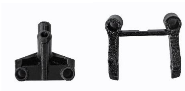
Rys. 17. Uchwyt anteny. 2 szt