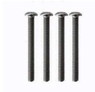
Rys. 3. M3 x 28 mm 4 szt