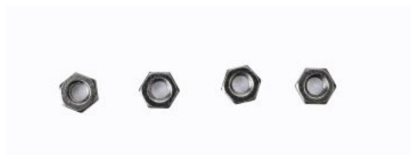
Rys. 10. M3 4 szt