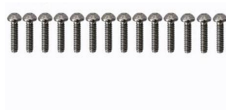
Rys. 6. M3 x 8 mm 14 szt