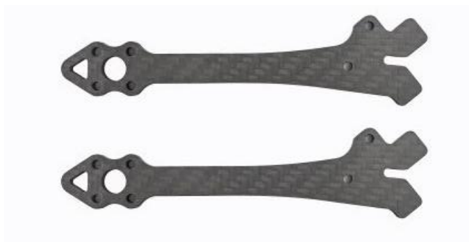
Rys. 16. Ramiona. 4 szt