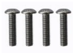
Rys. 5. M3 x 12 mm 4 szt