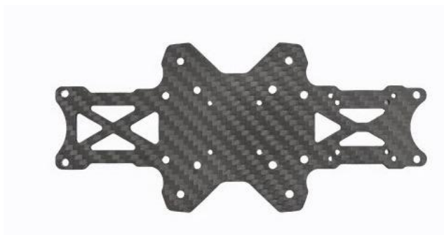
Rys. 13. Płyta C. 1 szt