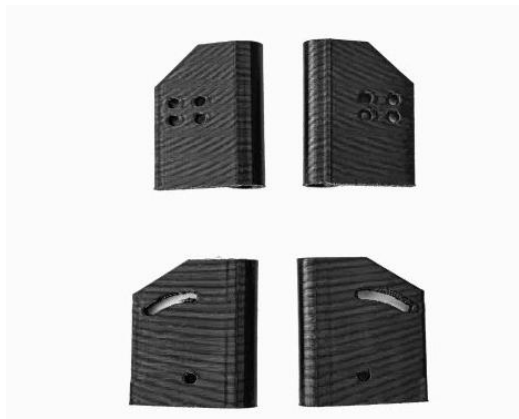
Rys. 18. Uchwyt kamery. 2 szt