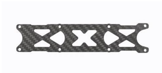
Rys. 11. Płyta A. 1 szt