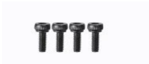
Rys. 1. M2 x 5 mm 4 szt