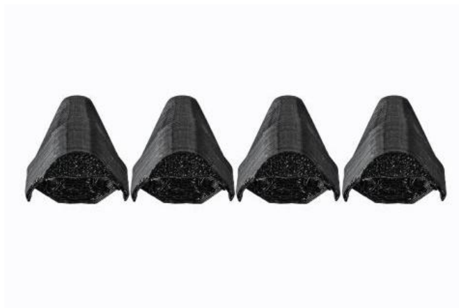
Rys.20. Ochrona ramion. 4 szt