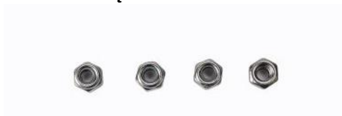
Rys. 9. M3 4 szt