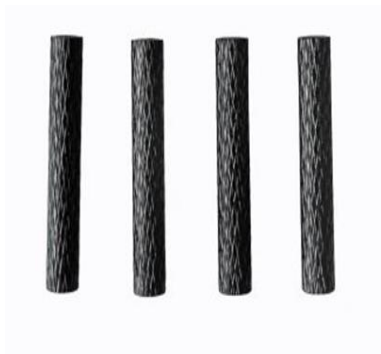
Rys. 8. M3 x 29 mm 4 szt