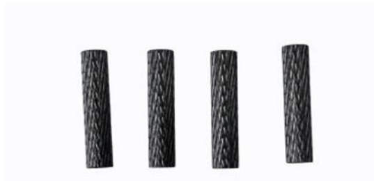
Rys. 7. M3 x 29 mm 4 szt