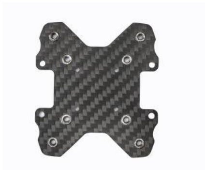
Rys. 12. Płyta B. 1 szt