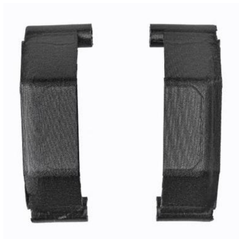
Rys. 19. Ochrona stack. 2 szt