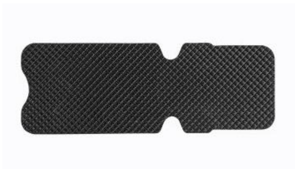
Rys. 15. Gumowa podkładka. 1 szt