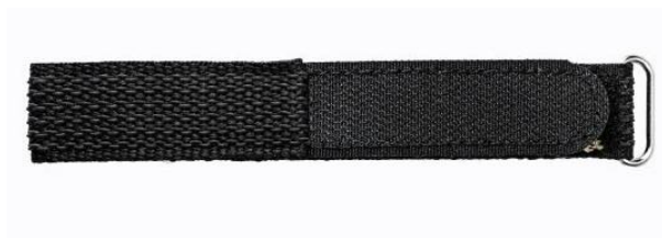
Rys. 14. Pasek mocujący. 2 szt